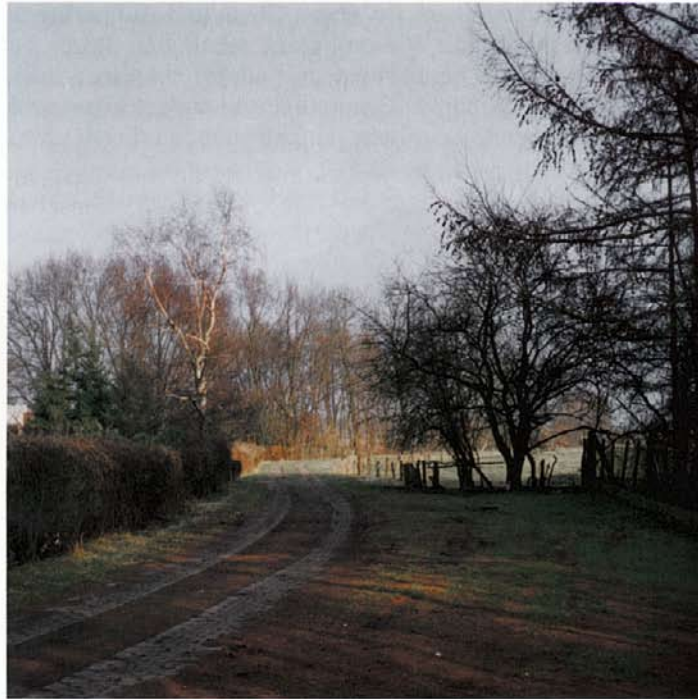
Der Weg in die Wiesen

Nach ca. 800 m biegt der Weg links ab und überquert die erste alte Holzbrücke am Fangstakengraben. Die Brücke war früher bei der damaligen Breite des Wasserkanals, die überwiegend durch den höheren Wasserstand gegeben war, bedeutend größer. Der Fangstakengraben, der zeitweise Schiffgraben hieß, ist schon vor vielen hundert Jahren durch eine Erweiterung des alten Mühlengrabens, der vom Kloster hierher führt, entstanden. Auf solchen Wasserwegen, die überall die Niederung durchzogen, wurde nicht nur der Torf aus den Abbaugebieten zum Verkauf nach Bremen transportiert, sondern auf ihnen wurden auch Menschen, Tiere und Waren befördert und die Ernten der anliegenden Wiesen und Felder eingebracht. Die schmalen und flach gebauten Torfkähne konnten die oft engen Kanäle leicht passieren.