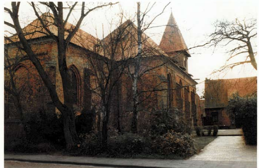
Neben der Kirche das alte Hospiz, erbaut 1562