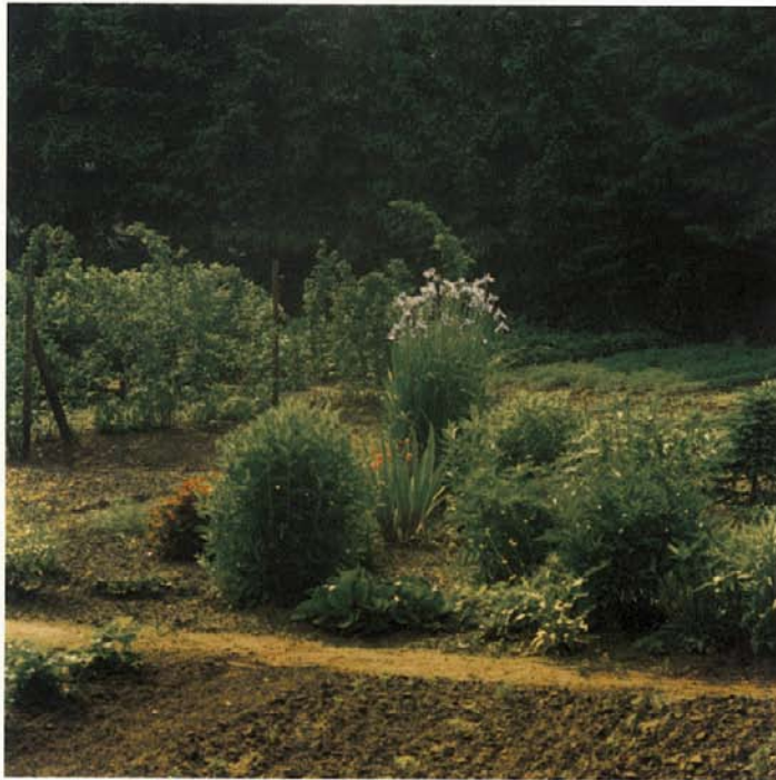
Zwischen den Hecken große Gärten

Den Platz verläßt man durch einen schmalen Gang zwischen Kirche und dem früheren Klosterhospiz und Armenhaus aus dem Jahre 1562 und trifft danach auf einige alte, liebevoll für heutige Wohnzwecke hergerichtete Bauernhäuser und Gär-