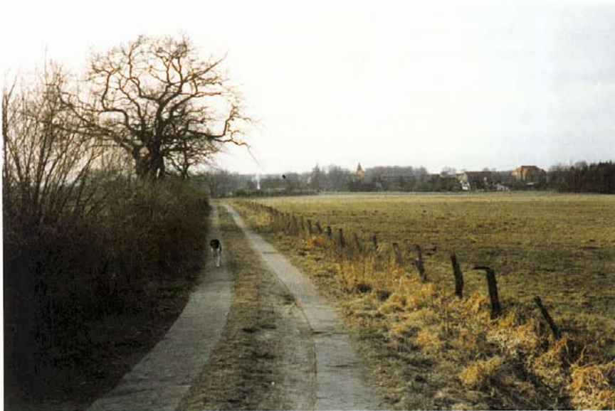
Kirchdamm mit Blick auf Osterholz

Vor uns haben wir nun das Weichbild von Alt-Osterholz. Am Ortsrand biegen wir nach rechts in die Mühlenstraße ein. Hier stehen noch verschiedene alte Bauernhäuser auf den Grundstücken der sogenannten kleinen Hofstellen. Die Besitzer, die auf dem Grund und Boden des Klosters bauen durften, bekamen vom Kloster das Holz zum Aufbau des Hofes und auch für spätere Reparaturen umsonst. Dafür waren sie zinspflichtig. Die Erben des jeweiligen Hofstellenbesitzers mußten das Haus vom Kloster wieder neu erwerben. Diese kleine Straße wird am Ende rechts von einer schönen alten Mauer begrenzt. Gegenüber ist die Rückseite des 1858 erbauten Amtsgerichtes zu sehen. Am Ende dieses Gebäudes biegen wir nach links auf den Klosterplatz, wo die eindrucksvolle Amtslinde steht.