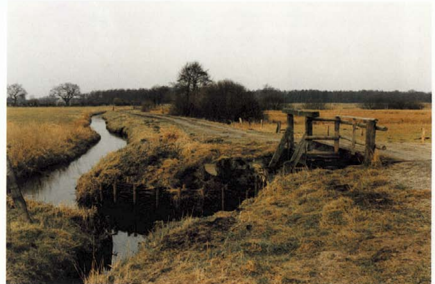
Brücke über den Fangstaken