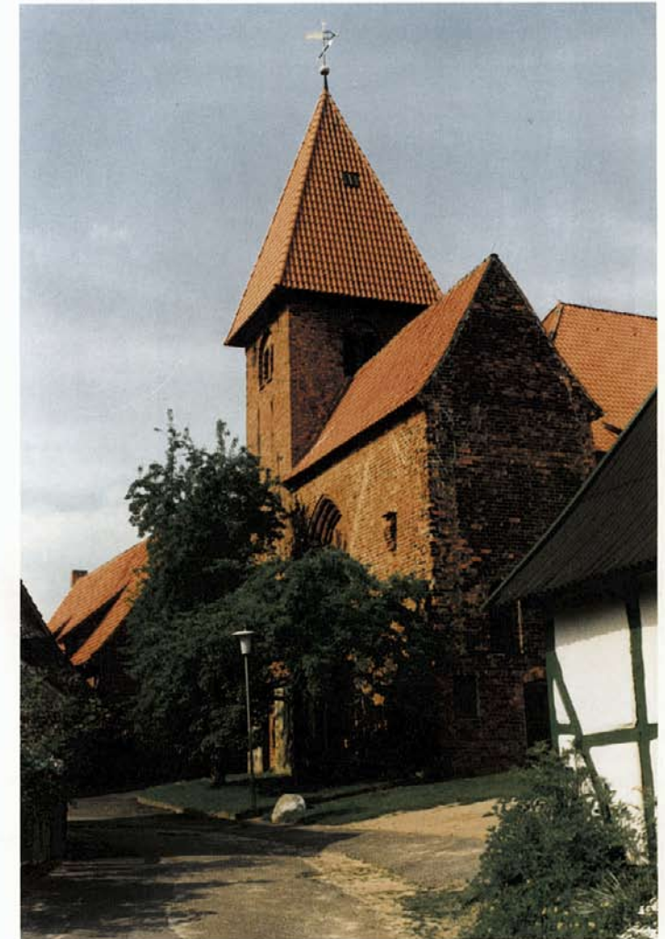
St. Marienkirche zu Osterholz

Im Dachstuhl der Kirche nisten die seltenen Schleiereulen. Außen an der Kirchenwand sind die noch erhaltenen zwölf Grufplatten angebracht. Sie bedeckten einst Grabstätten von Präbsten und Priorinnen. Die älteste Grabplatte, die des Probstes Hermann Horn, trägt die Jahreszahl 1454. Die eingemeißelten Wappen künden von den väterlichen und mütterlichen Vorfahren der Insassinnen des Klosters, meistens Töchter des