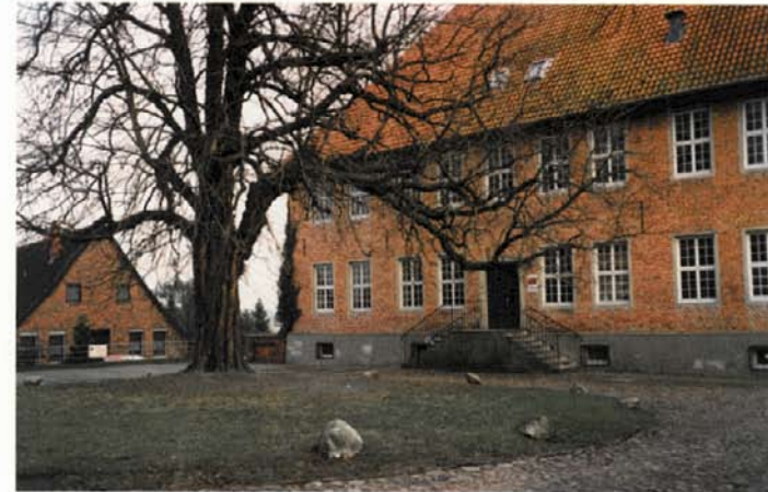
Das ehemalige Amtshaus

Während wir auf die Klosterkirche St. Marien zugehen, fällt der Blick auf das ehemalige Amtshaus, das im Sommer hinter der vor ihm stehenden gewaltigen Kastanie fast verschwindet. Das Haus wurde 1728 auf dem Kreuzgewölbe eines Klostergebäudes errichtet, das der Domina des Klosters als Wohnung gedient haben soll. Dort ist jetzt eine Schule für behinderte Kinder untergebracht.