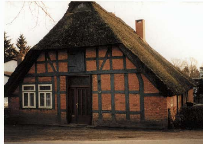
Das alte Kätnerhaus