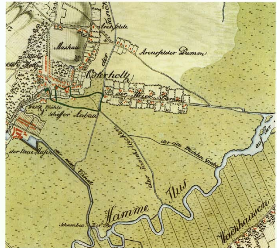
Karte, 1764/66 aufgenommen durch Offiziere des Hannoverschen Ingenieurkorps Osterholz, Ortsteil Weyerdamm, die alten Wasserwege und die Hamme